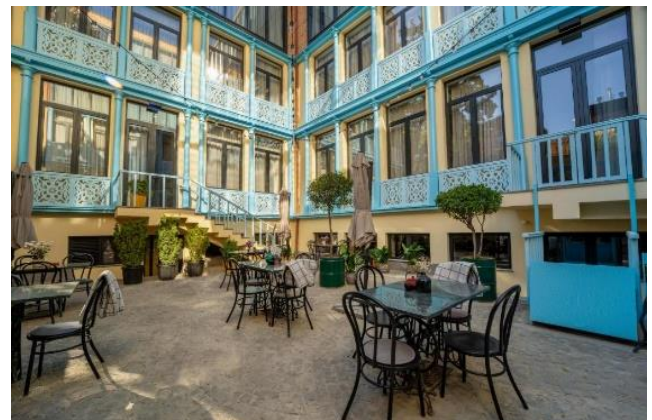
Boutique Hotel Makmani